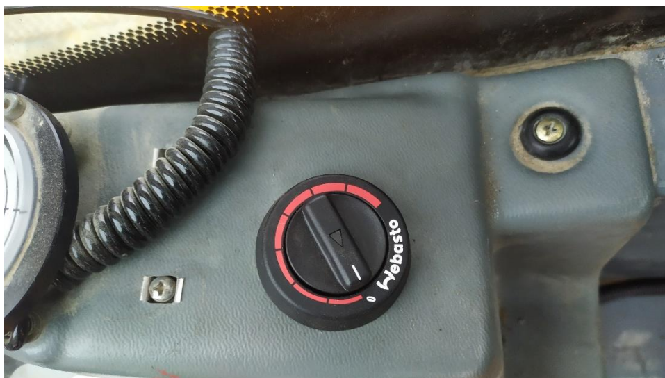
włącznik obrotowy podgrzewacza