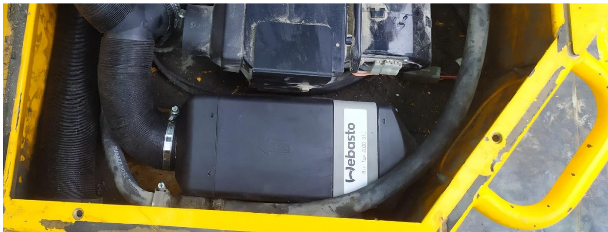
agregat Air Top 2000 STC